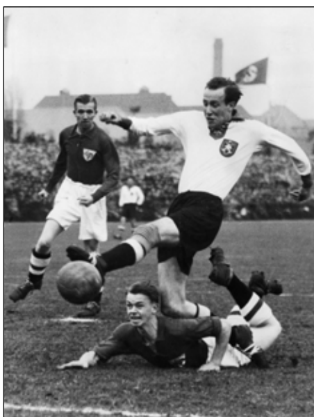
Danmark møder Tyskland i november 1940. Billedet er fra bogen 'Fodbold med fjenden'.

"Det var første gang, jeg kom til København som idrætsudøver. Jeg blev student i 1941 og skulle på et kursus som forberedelse til Officerskolen. Når jeg tog imod invitationen, var det en praktisk mere end en moralsk vurdering, jeg skulle lede efter